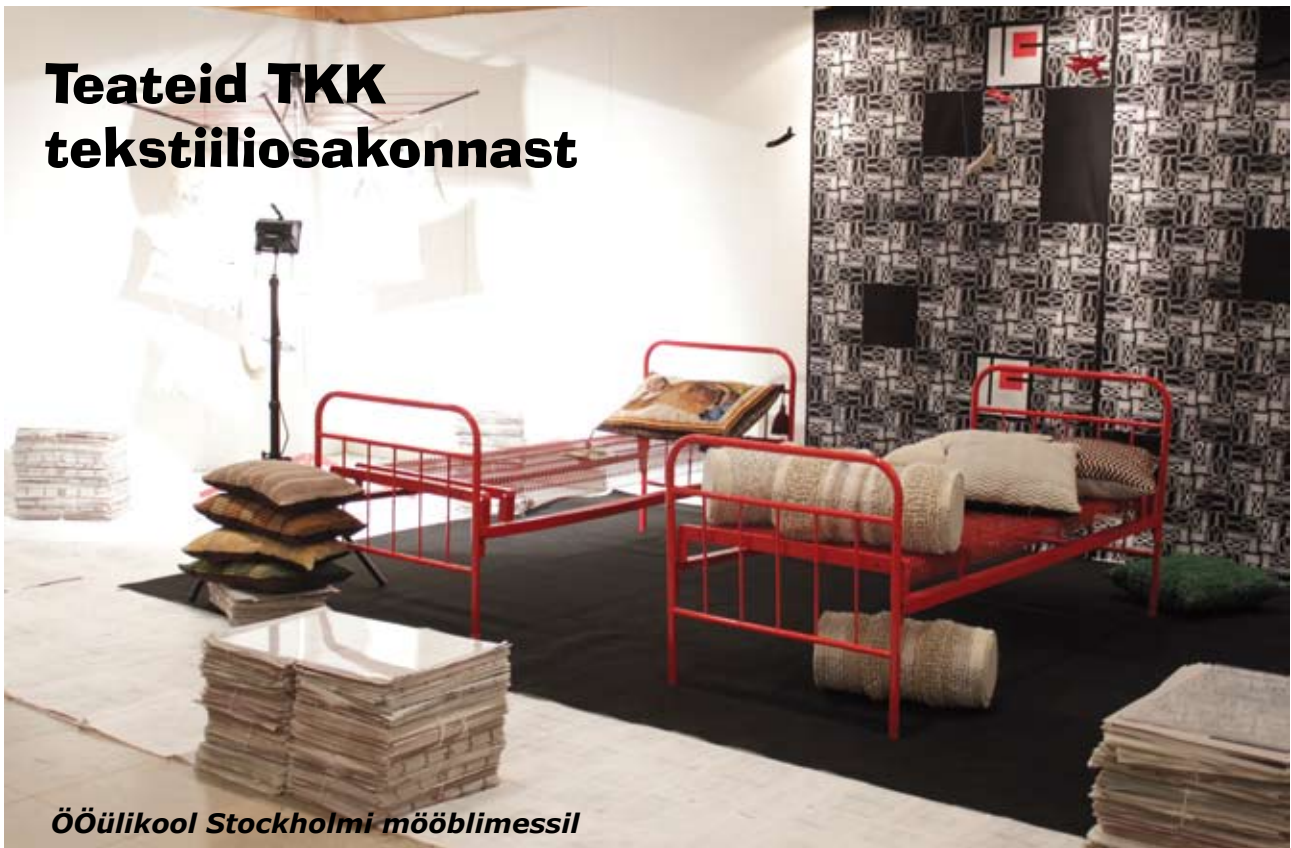
Ööülikool Stockholmi mööblimessil